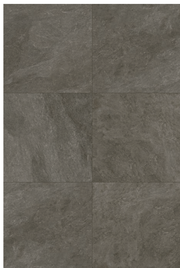
Gales BK 120x120 / 48x48"