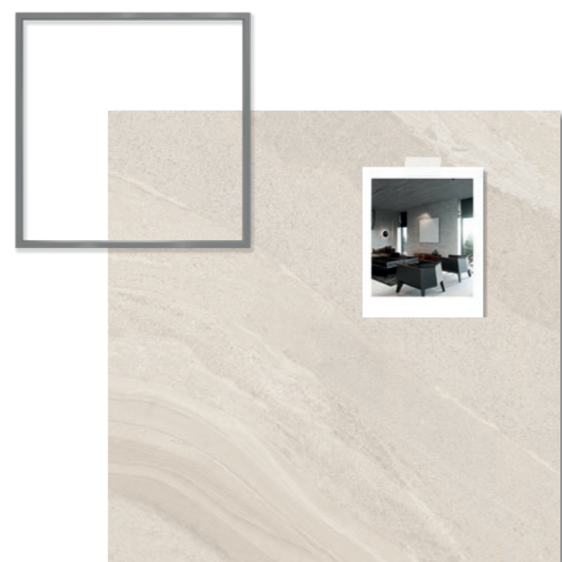
Gales SGR NAT 120x120 / 48x48"

As marcas e intempéries nos solos das grandes cidades do mundo são expressadas em porcelanato. Essa pulsação urbana serviu de inspiração para a coleção Città, que carrega em sua superfície os traços das grandes metrópoles e características do cimento queimado. Com design marcado com leves nuances, composta por uma paleta de cinco cores que permeia dos tons frios aos quentes, a coleção remonta a sobriedade dessa atmosfera urbana que abriga grande parte da população.