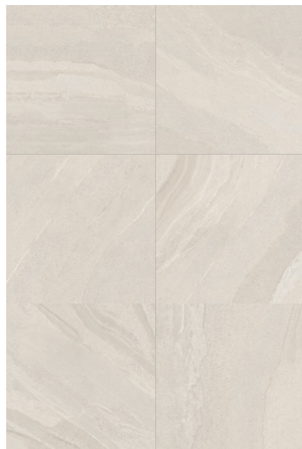
Gales SGR 120x120 / 48x48"

Variação visual Shade variation | Variación de tono