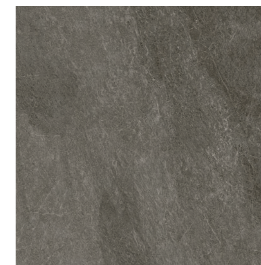
Gales BK 120x120 / 48x48" NAT / HARD RET V3 - USO 5