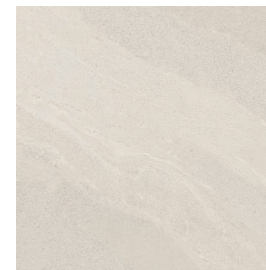
Gales SGR 120x120 / 48x48" NAT / HARD RET V3 - USO 5